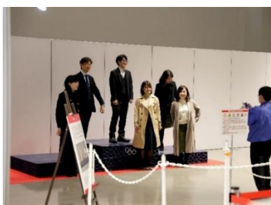
<写真撮影スポットの設置>