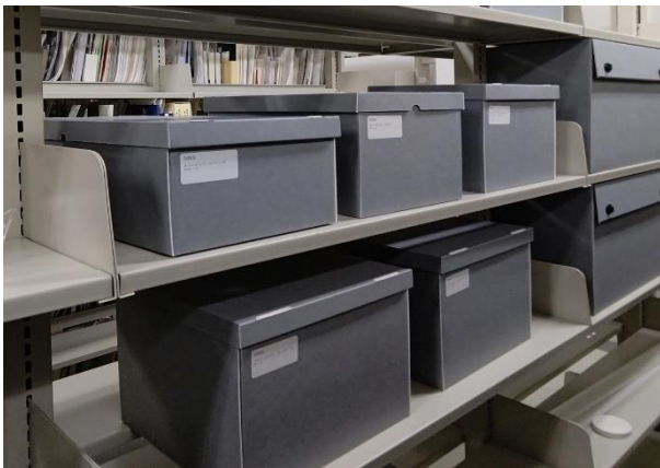
<適切な保存環境での管理>