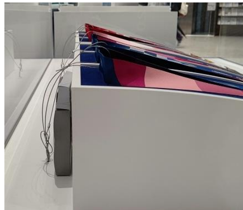
<展示場所における防犯対策>