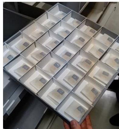
<資産の特性にあわせた保存方法>