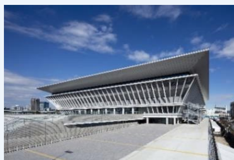
<東京アクアティクスセンター>