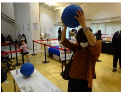
<アクション(触れる)できる展示>