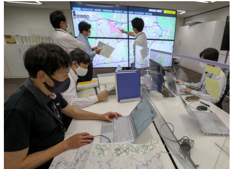
輸送センターの様子