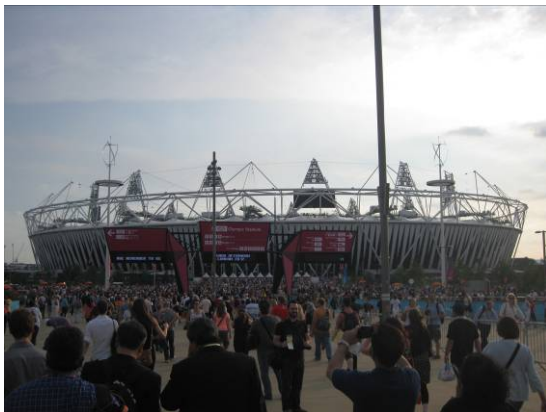
オリンピックパークを視察