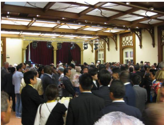
レセプション会場