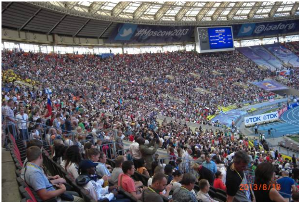
観客席の状況（大会8日目、8月17日）