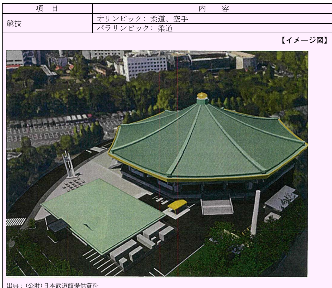
表 4-1 会場の概要（日本武道館）

東京 2020 大会では、オリンピックの柔道及び空手、パラリンピックの柔道の会場として利用される計画である。