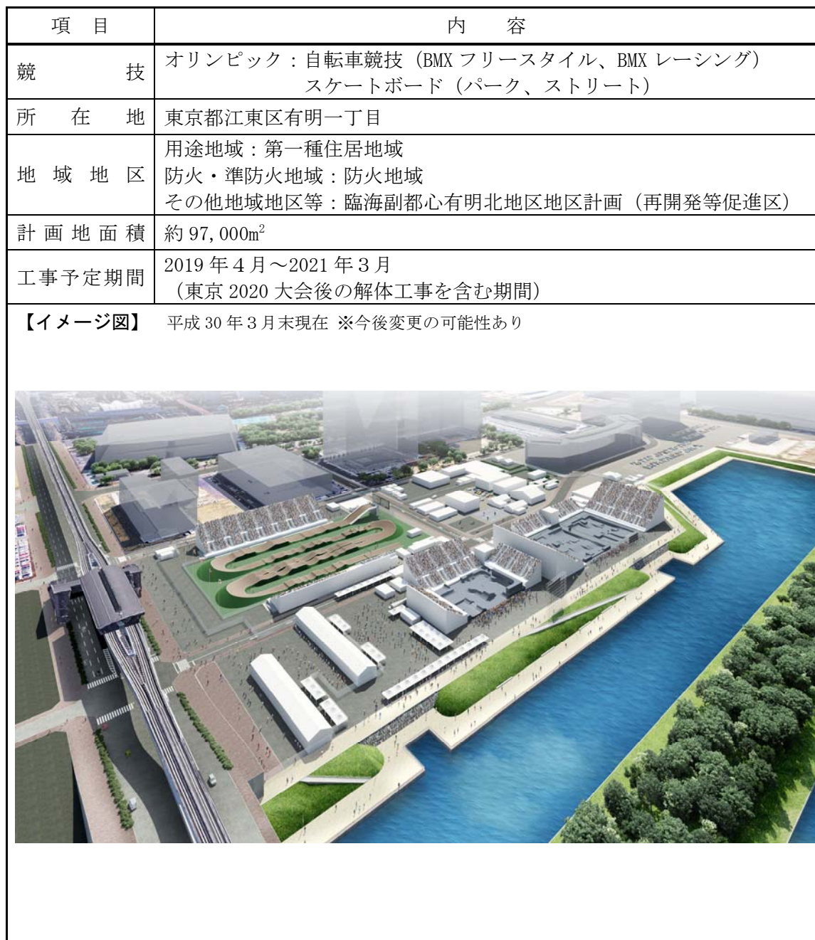
表 4-1 本施設の概要 (有明アーバンスポーツパーク)

有明アーバンスポーツパークは、(公財)東京オリンピック・パラリンピック競技大会組織委員会が仮設で整備する競技場であり、東京 2020 大会では、オリンピックの自転車競技 (BMX フリースタイル、BMX レーシング)、スケートボード (パーク、ストリート) の会場として利用される計画である。