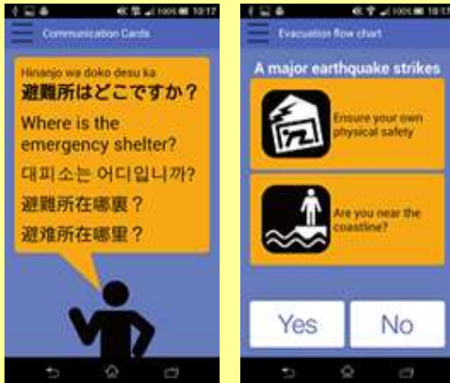
多言語で防災・災害情報を 提供するアプリ