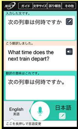
多言語音声 翻訳アプリ