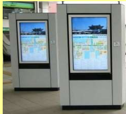
スマートフォンと情報連携を 行うデジタルサイネージ