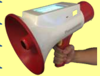
メガホン型翻訳機