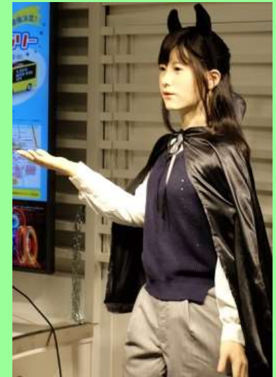
多言語で観光案内を 行うアンドロイド