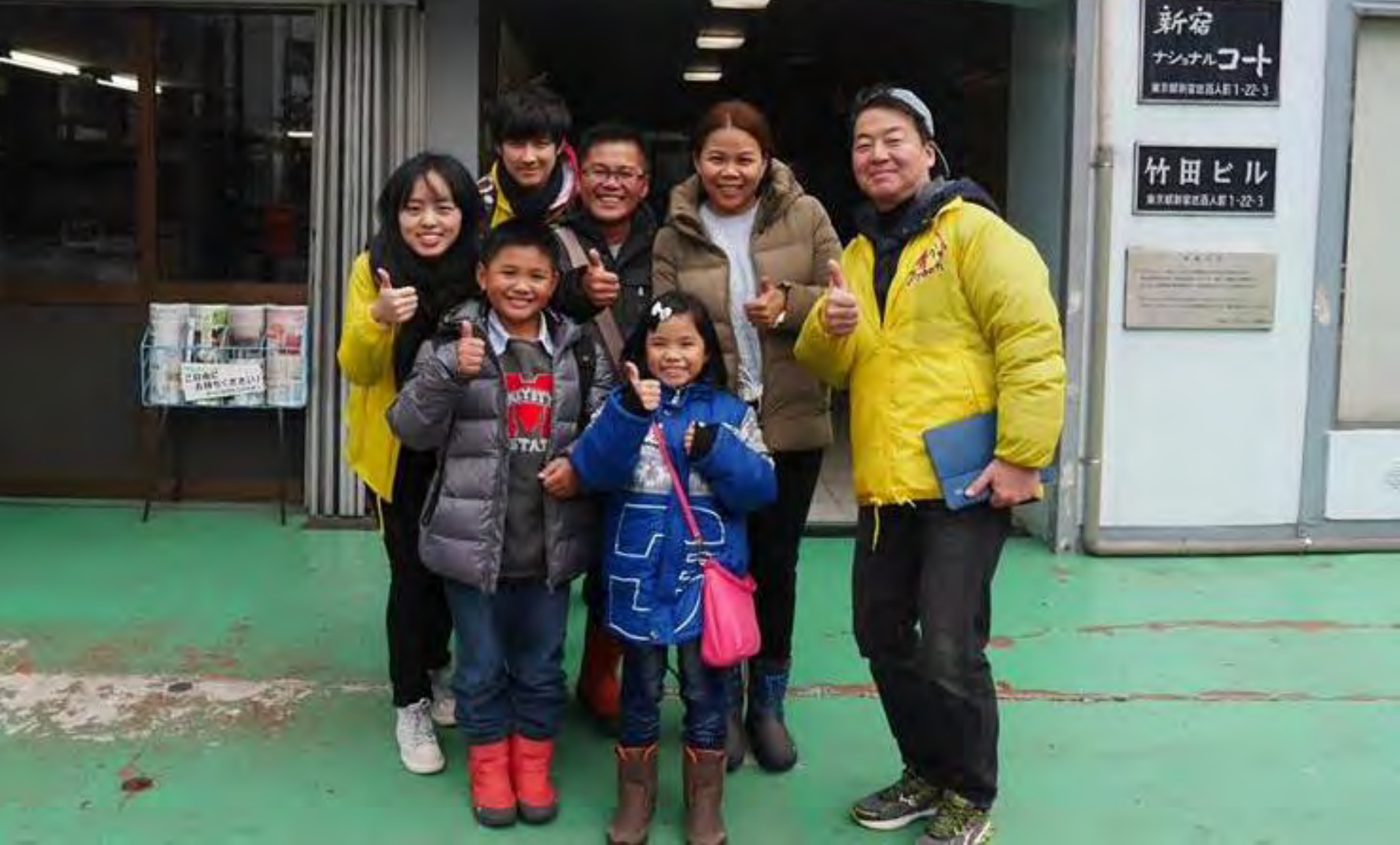
新宿 新宿駅近くでスマホを見ながら何か探している マレーシアからの家族>>>エアビ宿までご案内。