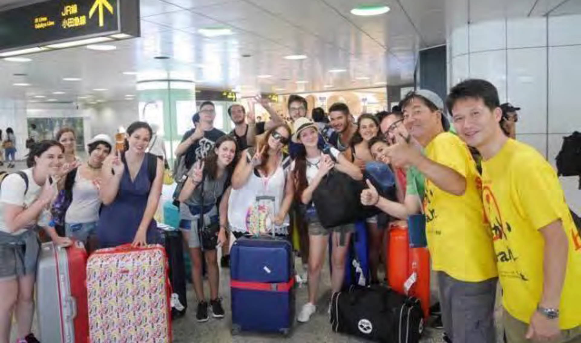
新宿駅 イタリアから着いたばかりの学生さんと先生 17人分の大型コインロッカー探し。