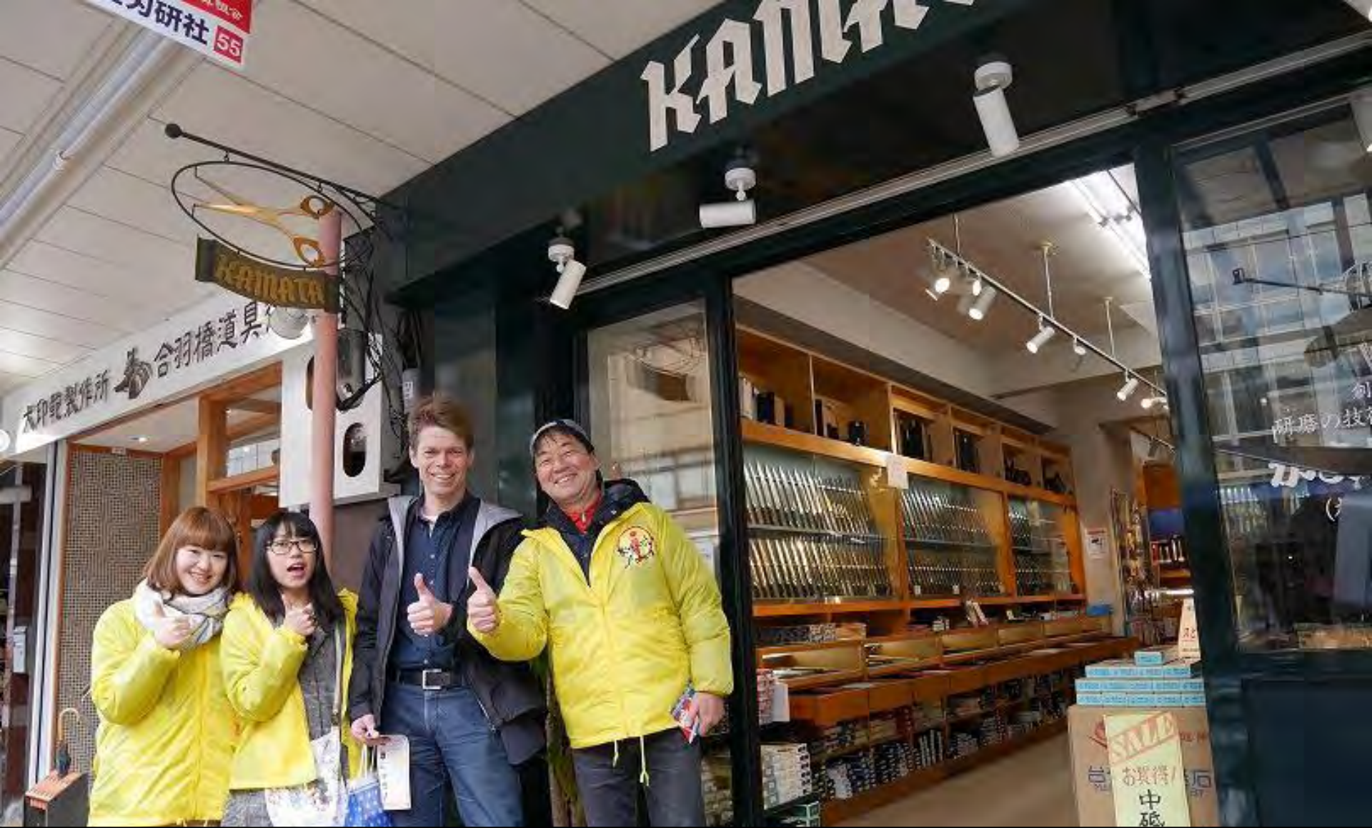
浅草 地図を見ながらうろろうろしていたスウェーデン人 >>>浅草合羽橋のKAMATAで包丁を買いたい。。。