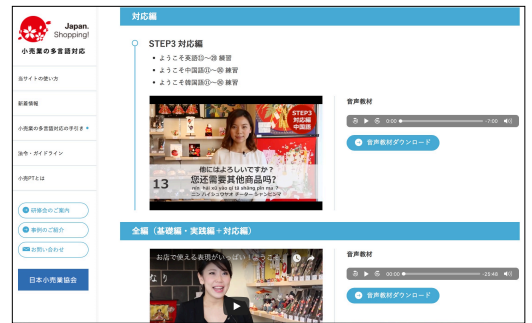
↑ 動画（基礎編・実践編・対応編）を通して3ヶ国語の「ようこそことば」を学べます

基本的な接客用語を「ようこそことば」と命名し、3カ国語（英語・中国語・韓国語）の覚えやすい表現に翻訳して動画と音声にて公式WEBサイトに公開いたしました。どの教材も個人、企業を問わずどなたでも無料で利用可能です。今後、本教材を活用した教育プログラム「ようこそことば勉強会」の開催を推進するために、認定講師制度を新設。既に認定講師を有する教育企業を下記に公開するとともに、9/28（金）に第1回認定講師養成講座を開催いたします。 ※公認サービス「ようこそことば勉強会」実施企業 (株)インディゴジャパン、(株)ワンストップ・イノベーション、 (株)マイスター60、(株)三越伊勢丹ヒューマン・ソリューションズ、 (株)ライフブリッジ