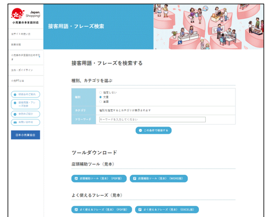
↑ ブランドリスト、商品カテゴリなど、小売現場でよく使われる用語・フレーズを検索できる。

訪日ゲストの接客現場で利用頻度の高い用語・フレーズ13,000件超を公式WEBサイトにて公開いたします（9月19日予定）。サイトでは、日本の主なブランド名の外国語（英中韓）表記約11,000語、商品カテゴリ約1,700単語、接客フレーズ・用語を約650文・用語を検索・利用できる機能を無料で提供します。国内初の小売業界に特化した接客用語検索サービスです。本検索サービスは、小売PTの接客コミュニケーションワーキンググループの事務局の一員である(株)NTTドコモが事務局として情報収集・データベース化し、(株)エスケイワードがWEB検索のシステムを開発いたしました。 併せて、対訳リストを搭載した下記の多言語接客サポートアプリを公認サービスとして認定するとともに、対訳リストの利用企業を継続して募集し、利用を促進します。