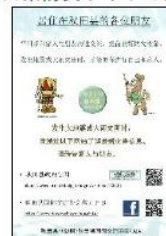
⑤秋田県防災サイトの案内チラシ