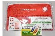
③防災グッズ (救急セット・LEDライト付きホイッスル)