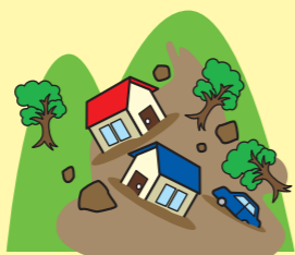
Landslide 土石災害 토사재해