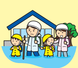
Flood 洪水 홍수