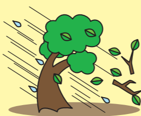
Strong wind 強風 폭풍