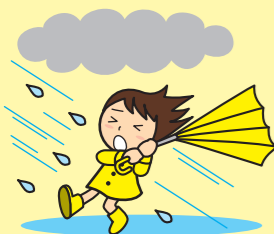
Heavy rain 大雨 호우

등록을 할 때는, 반드시 이용 규약을 잘 읽어 주셔서. 등록 페이지는, 메일 전달 서비스의 수탁 업자의 홈 페이지입니다. 수탁 업자는, 「야치요시 개인 정보 보호 조례」에 근거하는 보호 조치를 준수해 업무를 실시합니다. 등록이나 메일 수신에 걸리는 통신비는, 등록자의 부담이 됩니다.