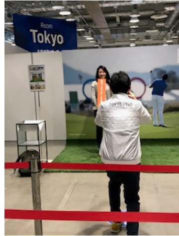
参加者から人気の フォトスポット