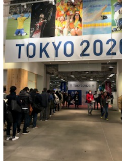
受付開始前の行列