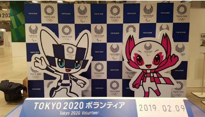
楽しめる装飾（装飾協力：日本財団様）