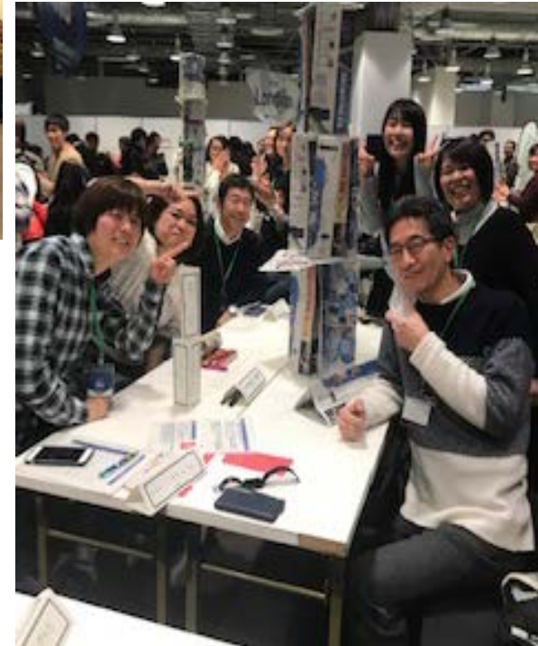
チームアクティビティ後、 笑顔で撮影！