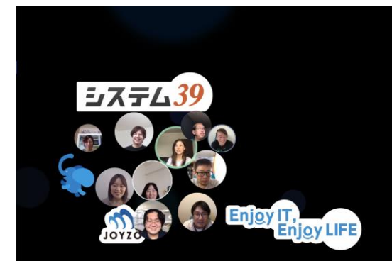
朝の雑談 (Spatial Chat)