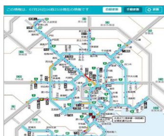
7/26 16:25 状況