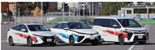
大会関係車両イメージ