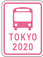
桜色の看板などが目印です。

選手などの大会関係者を輸送するルートにはこの看板が設置されます(優先レーンを除く)。ルートを選けて通行していただくなどご協力をお願いします。