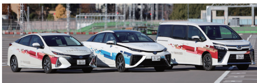
大会関係車両イメージ (車両の前後に「TOKYO2020」の標章を取り付けています)

選手などの大会関係者を輸送するルートにはこの看板が設置されます。ルート避けて通行していただくなどご協力をお願いします。