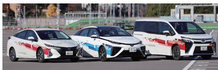
大会関係車両イメージ(車両の前後に「TOKYO2020」の標章を取り付けています)

選手などの大会関係者を輸送するルートにはこの看板が 設置されます。ルートを避けて通行していただくなど ご協力をお願いします。